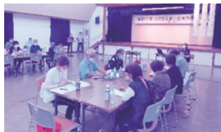
地域福祉懇談会の開催