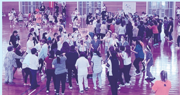
子ども達の応援受けて かあちゃんガンバル！