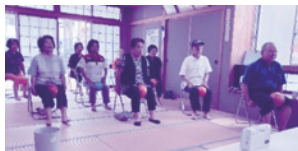
大川結結健康クラブ (体操の様子)

いつまでも住み慣れた地域で自立した生活ができるよう参加者同士で見守りながら楽しく活動していきます。