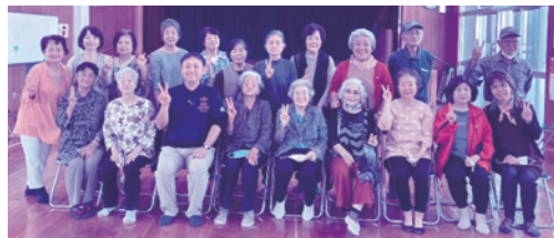
大川区地域デイサービス(集合写真)