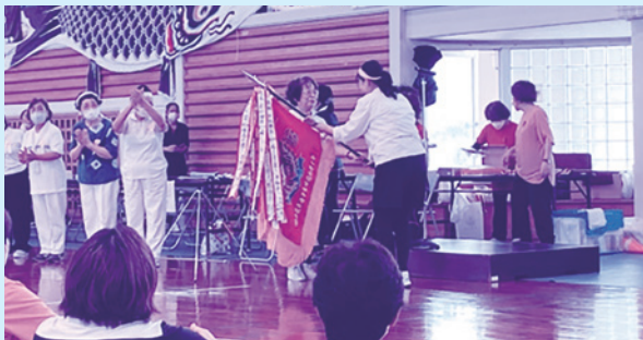
南部地区会長より県母連会長へ優勝旗の返還