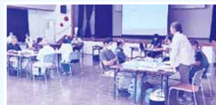
～ 情報交換会の様子 ～