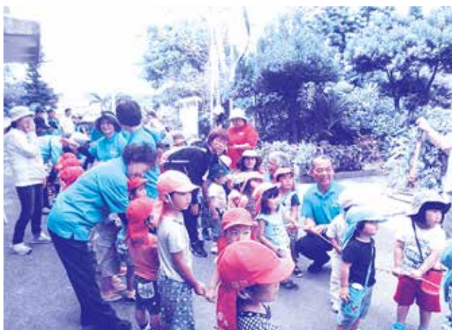
社協「こいのぼり掲揚式」への参加協力

法律に基づき、地域ごとに民生委員の組織（民生委員児童委員協議会）を設置しており、多くの仲間と一緒に活動しています。活動でどうしても良いか悩んだりした場合でも、仲間に相談し、複数で対応することもあります。また、役所や社会福祉協議会などの関係機関も民生委員・児の仕事をサポートしています。