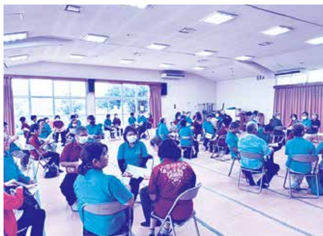
西原町民生委員・児童委員との情報交換会