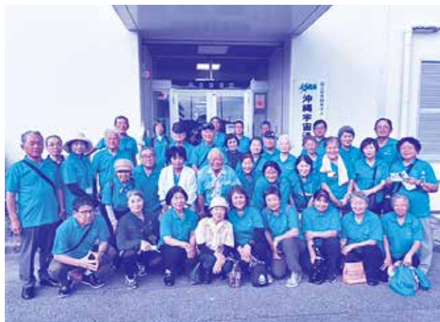
県内視察研修会(各民児協合同で参加)