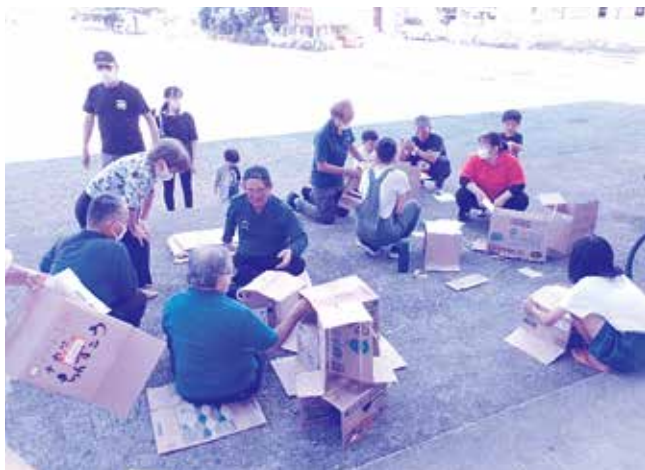
地域との交流活動&防災ワークショップ